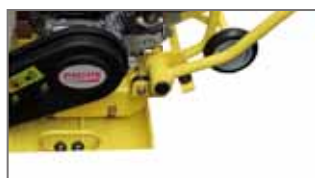
Roues de transport en série

Conception parfaitement équilibrée, conçue pour les chantiers exigeants.