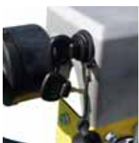
Boîtier de démarrage électrique