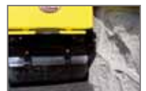
Surplomb réduit et dégagement mural amélioré