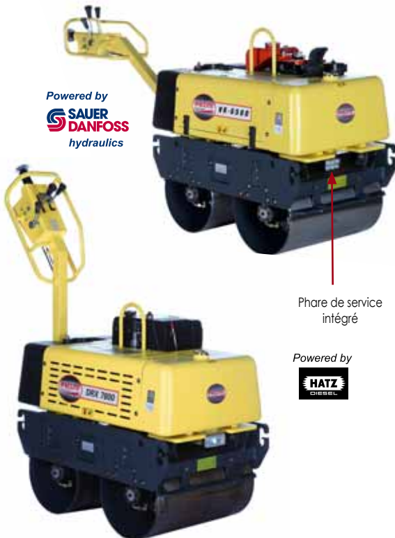
Phare de service intégré