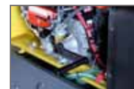
Manivelle pour démarrage manuel sur modèle Kubota