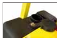
Réservoir d'eau 47 L