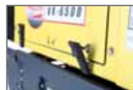
Capot de service ouvrable