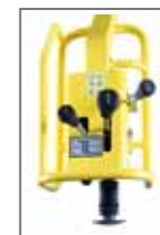
Poignée anti vibratil, protection des mains